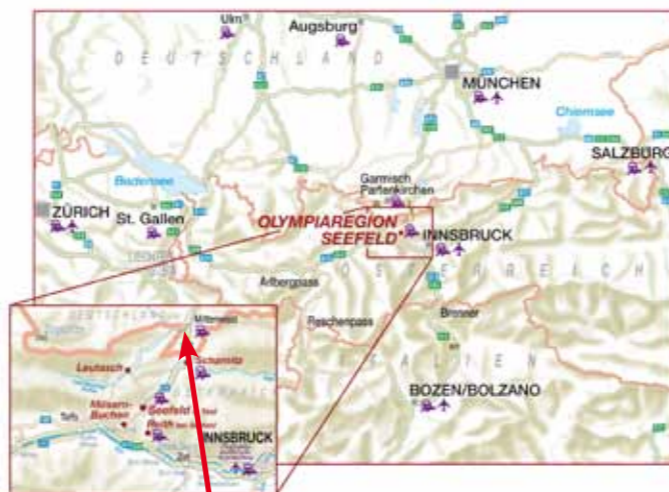
La gorge fantôme de Leutasch

Leutascher Geisterklamm Schanz | 6105 Leutasch www.leutascher-geisterklamm.at ouvert du début mai jusqu'à la fin octobre