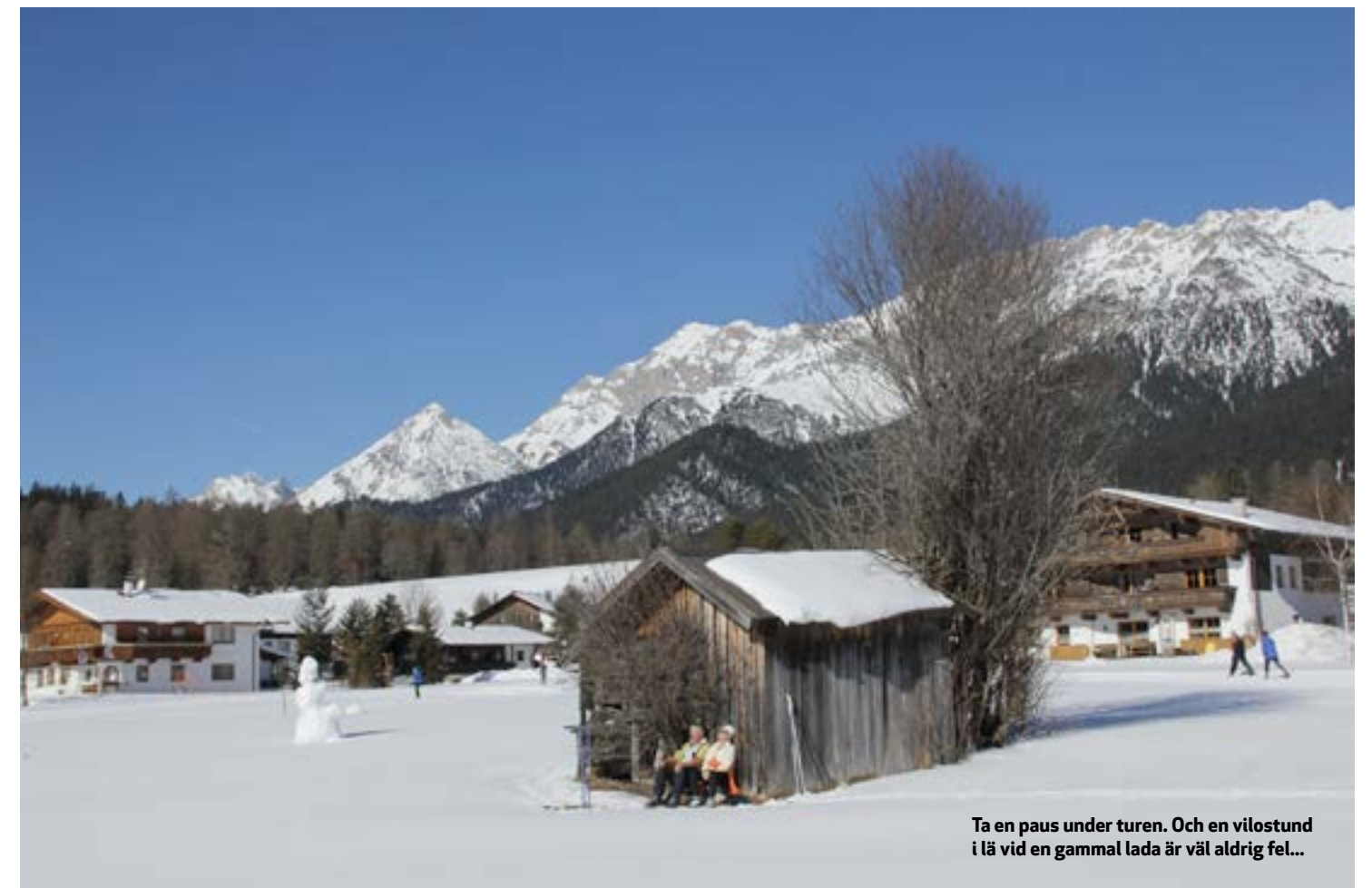
Ta en paus under turen. Och en vilostund i lä vid en gammal lada är väl aldrig fel...

A llt är perfekt. Strålände sol, vindstilla och fem minusgrader. Det har snöat några centimeter under natten och spåren är nypistade.