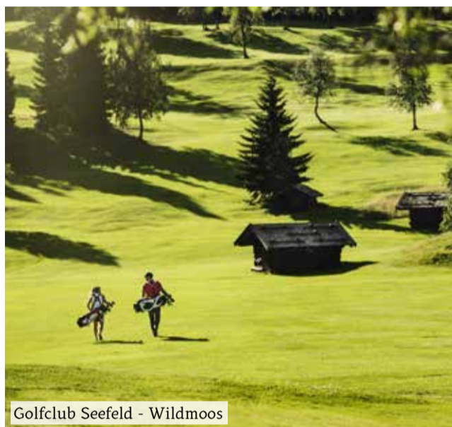
Golfclub Seefeld - Wildmoos

Pfarrkirche Mariä Heimsuchung | Parish church